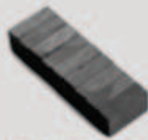
Aimants bruts en ferrite