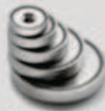
Aimants en pot